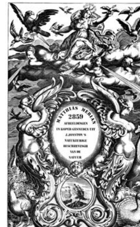
Amsterdam, by J. I. SCHEFFER op de Keyfers graet. 1660. - after Blodig van G. Jansz.

naar aanleiding van verhalen zijn getekend. Veel dieren lijken meer fantasiedieren dan natuurgetrouwe dieren. Zoals een samenstelling van een leeuw met een adelaar. Deze inspiratiebron zie je goed terug in de sculpturen op pagina 12.